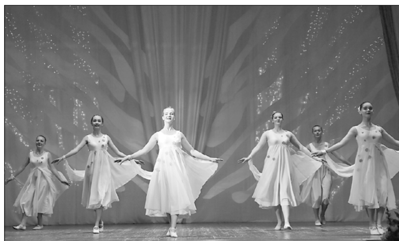
■ В подарок – выступления артистов