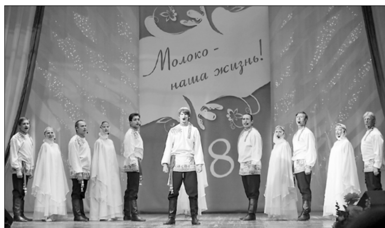
■ «Молоко – наша жизнь» – под таким девизом прошло торжество