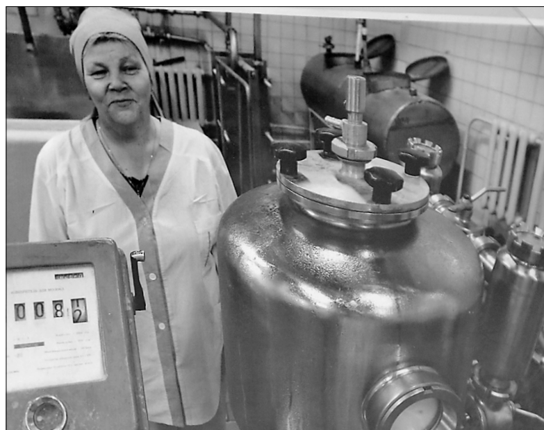
■ Советское прошлое молокозавода