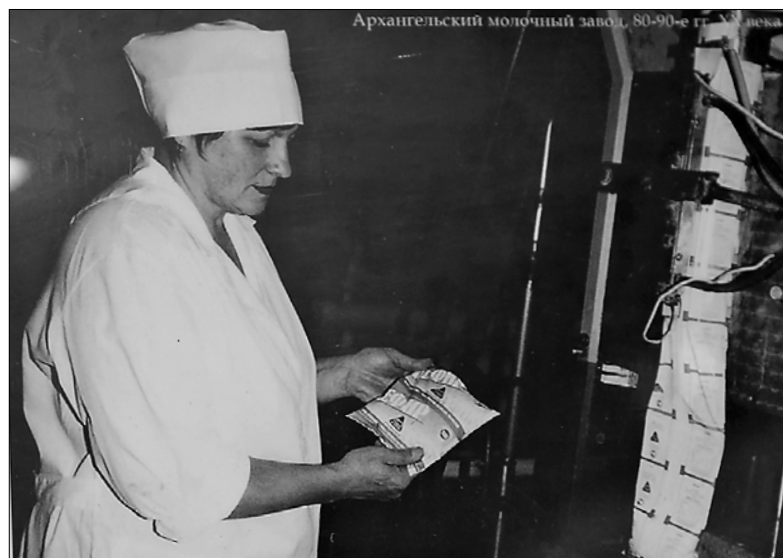
■ Архангельский молочный завод на архивных фотографиях

Но все же лучшей оценкой для любого предприятия, производящего пищевую продукцию, является покупательский спрос. Продукция ОАО «Молоко» давно любима горожанами – а это высшая награда.